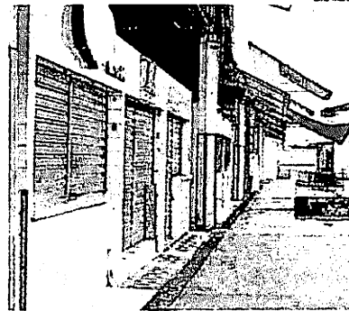
Boxes do Mercado da Liberdade estariam sendo comercializados

Em audiência pública, funcionários denunciaram o abandono geral dos mercados da capital